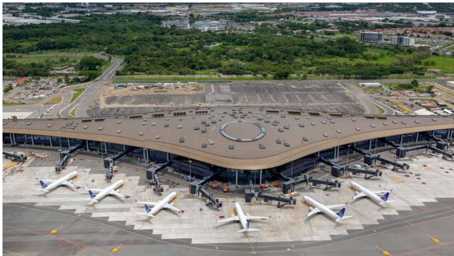
巴拿马图库门国际机场