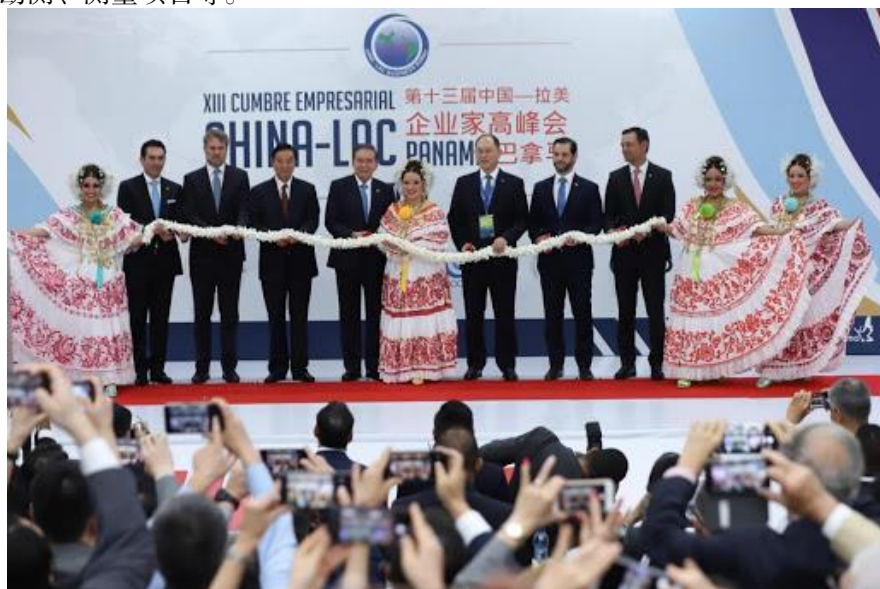
第十三届中拉企业家高峰会在巴拿马城举办

【承包劳务】据中国商务部统计，2019年中国企业在巴拿马新签承包工程合同41份，新签合同额1.8亿美元，完成营业额3.45亿美元。累计派出各类劳务人员13454人，年末在巴拿马劳务人员15431人。新签大型承包工程项目包括中国五环工程有限公司承建巴拿马天然气发电站LNG接收站项目；中交公路规划设计院有限公司承接巴拿马跨运河第四大桥工程勘测、测量项目等。