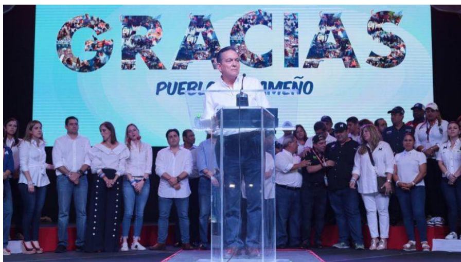
巴拿马总统科尔蒂索

【议会】国民大会为一院制，行使立法权。由71名议员组成。议员通过直选产生，任期5年。本届议会于2019年7月1日成立，各党派所占席位如下：民主革命党（执政党）35席，民主变革党18席，巴拿马主义党8席，民族主义共和自由运动党5席，无党派人士5席。国民大会主席马科斯·卡斯蒂列罗（Marcos Castellero，民主革命党），于2019年7月就职，于2020年7月再度当选连任，任期1年。