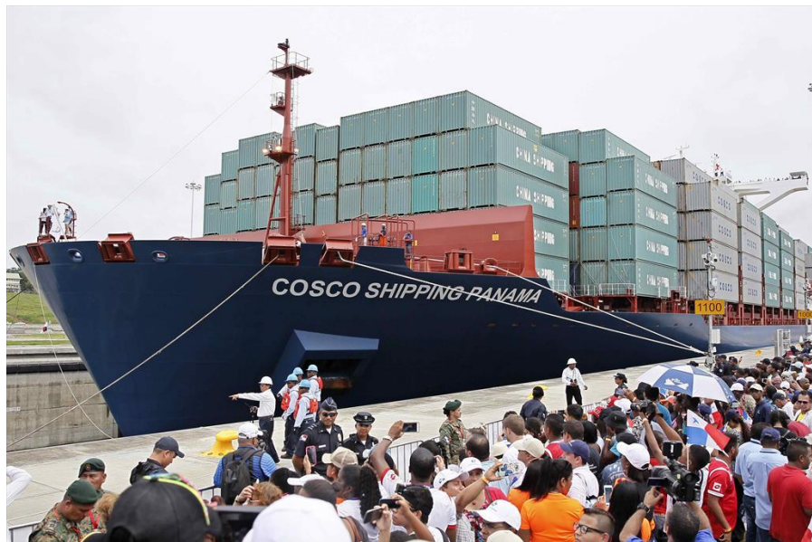
中远货轮通过扩建后的巴拿马运河

【巴拿马运河】巴拿马运河2020财年（2019年10月1日-2020年9月30日）通行船只13369艘，同比下降2%；通行货物4.751亿吨，同比下降4%。预计收入34.261亿美元，上缴财政18.24亿美元。