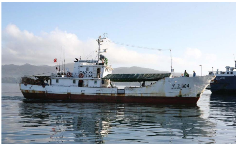
在斐济水域作业的中水公司渔业船舶

截至2020年5月，约40家中资企业在斐济开展经营活动，涉及渔业、旅游、矿产资源开发、通信、工程承包、房地产、制造业等领域。主要投资项目有：浙江天洁集团水泥厂项目、山东中润资源投资斐济瓦图科拉金矿公司、绍兴南太投资公司Nalaji（纳兰格）酒店项目等。