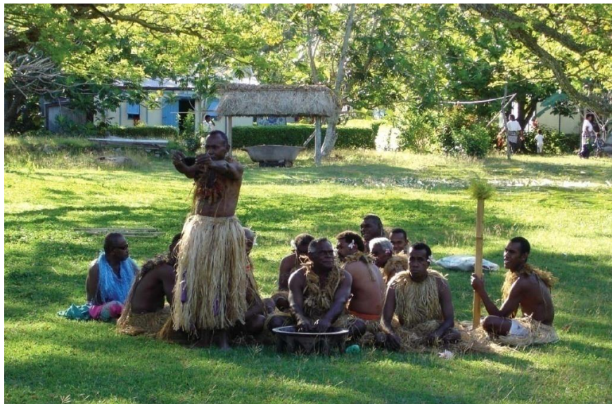
斐济敬献卡瓦仪式

如斐济族人请你喝Kava或Yagona，出于礼貌，不宜拒绝，喝完后叩掌三下以示感谢。进入斐济村落前需得到村长的许可，建议携带一些Yagona或食品作为礼物，进村后应将帽子取下，不要摸小孩的头。在进入斐济人家里时，要脱掉鞋子再进。斐济人以微笑和抬眉毛来互致问候，握手也可以。斐济人喜欢别人送礼物。斐济族人信奉基督教，用餐之前，常做简短祈祷，请客时也常如此，客人应站在一旁待对方祈祷完后再一起用餐。